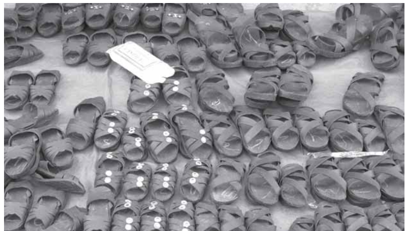
„Schuhe“ aus alten Autoreifen