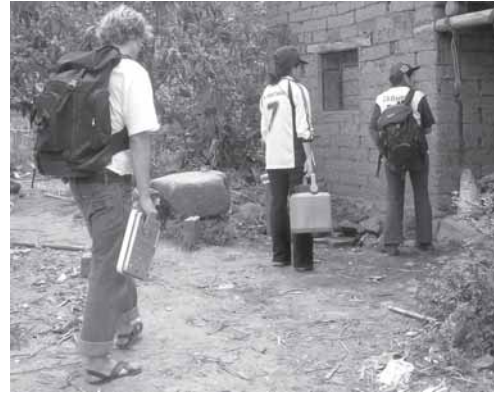
Impfaktion im Dorf El Naranjo

Wir sind über jede Spende dankbar. Bitte helfen Sie uns, die medizinische Grundversorgung der Menschen im Alto Chicama Tal in den peruanischen Anden weiterhin sicherzustellen.