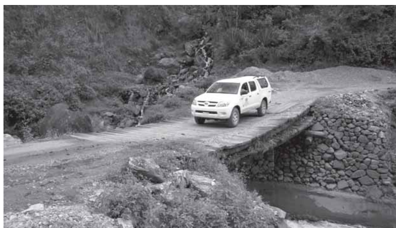
Der neue Toyota im Einsatz