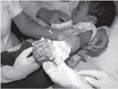
Verbrühungen bei einem Kind

Leistenbrüchen. Es waren mit Arbeit erfüllte Tage, neben Operationen, Visiten, Ambulanzpatienten und kollegialen Gesprächen blieb nur einmal Zeit für einen kleinen Ausflug von 3 Stunden in die Umgebung.