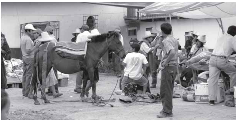
Auf dem Markt in Coima